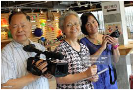
تصویر ۳. خبرنگاران سالمند در ژاپن

با بررسی و بازخوانی تجربه‌های جهانی، برخی آموزه‌ها را جهت بهره‌گیری در کشور ایران استخراج می‌کنیم که می‌تواند در مدیریت پدیده بازنشستگی و سالمندی مورد توجه قرار گیرد؛