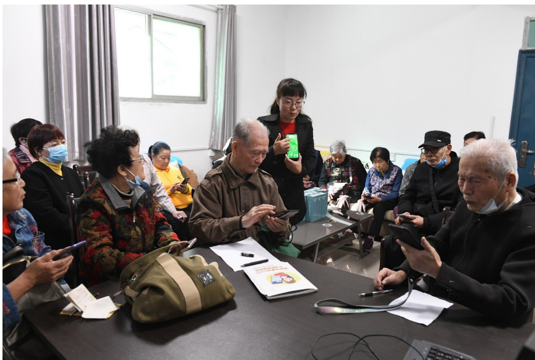
تصویر ۱. آموزش گوشی هوشمند به سالمندان در چین سال ۲۰۲۰ (https://news.cgtn.com/news)

و مهم‌تر اینکه بتوانند از نتیجه این آموزش در بهبود شرایط زندگی خود استفاده کنند. وزارت آموزش، فرهنگ، ورزش و علم و فناوری در ژاپن ۶ این برنامه را اجرا می‌کند و گروهی از نهادهای محلی نیز در اجرای این طرح به آن کمک می‌کنند. در چارچوب برنامه‌های اجرا شده در این طرح، بسیاری از دانشگاه‌ها، دوره‌های آموزشی برای گروه‌های مختلف از جمله افراد سالمند که به سن بازنشستگی نزدیک می‌شوند، برگزار می‌کنند. این دوره‌ها، معمولاً در مکان‌های عمومی و محلی ارائه می‌شوند و همه افراد می‌توانند در آن‌ها شرکت کنند. هدف این برنامه‌ها، هم آموزش‌های شخصی و هم آموزش‌های شغلی برای آغاز دوره‌ای جدید در زندگی است. نکته مهم در برگزاری این جلسات و دوره‌های آموزشی این است که بر اساس ارزیابی‌های انجام شده گروه‌های سنی بالای ۶۰ سال، تقویت ارتباط‌های شخصی با دیگران، یافتن دوستان جدید و داشتن زندگی با معنا در دوران پیری، از جمله مواردی است که افراد به عنوان انگیزه خود برای شرکت در این دوره‌ها اعلام کرده‌اند (مکس، ۲۰۰۹).