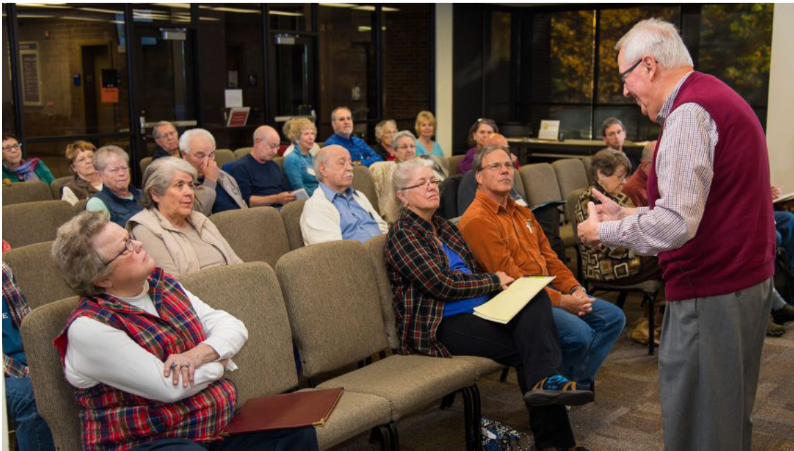
تصویر ۲. آموزش مادام العمر سالمندان ( https://www.blueridge.edu )

از طریق روابط چهره به چهره، یک مربی آموزش دیده داوطلب با شرکت‌کنندگان در مورد شیوه‌های بهبود وضعیت بحث می‌کند. اگرچه طراحی و نظارت این برنامه بر عهده افراد متخصص و آموزش دیده است، اما خود افراد سالمند هدایت‌کننده جلسات هستند. در الگوی سوئدی این طرح چارچوب توانمندسازی بر اساس چهار محور اصلی زیر شکل می‌گیرد: ۱. امنیت در خانه، ۲. شبکه‌های اجتماعی، ۳. غذا و نوشیدنی، ۴. تحرک (عمادی و نصر اصفهانی، ۱۳۹۷: ۷۳). در راستای خدمات اجتماعی سالمندان همچنین پارلمان سوئد اهداف کلی زیر را به عنوان زیربنای سیاست‌های سالمندان در نظر گرفته است: